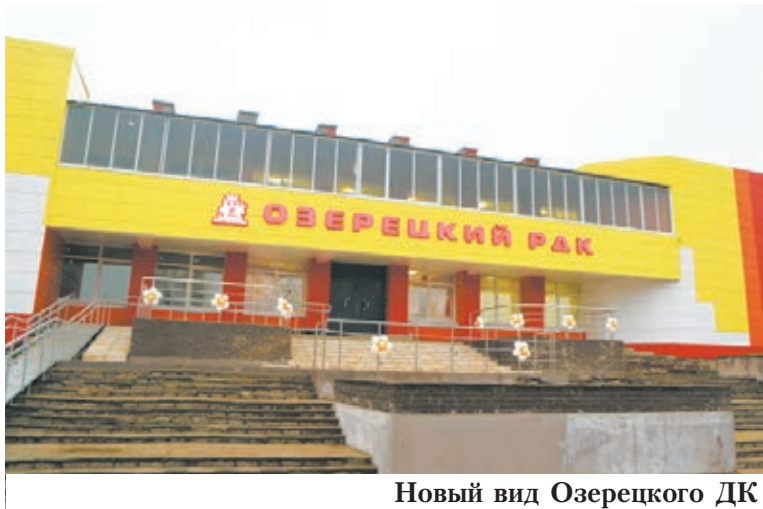
Новый вид Озерецкого ДК