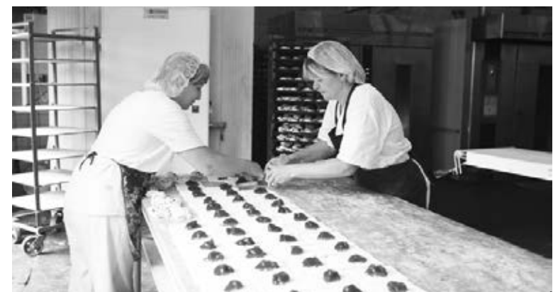
На предприятии "ОреховоХлеб"

Зуеве, Ликино-Дулево и Куровском. Общая численность персонала составляет 505 человек, из них 133 работают в городе Ликино-Дулево. Мощности предприятия способны ежедневно выпускать около 100 тонн хлебобулочных изделий, но сегодня такие объемы ни к чему, предприятие фактически загружено на 25-30 процентов и при этом обеспечивает своей продукцией около 60 процентов жителей района и города Орехово-Зуево. Все остальное достается конкурентам, которых у предприятия немало.