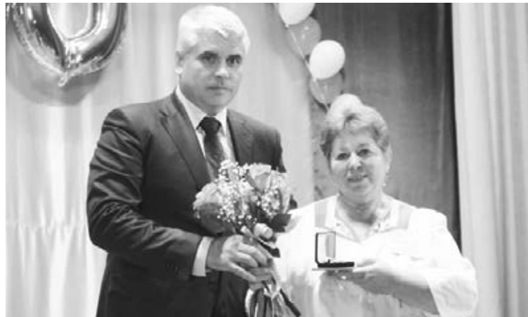
Награждение работников интерната