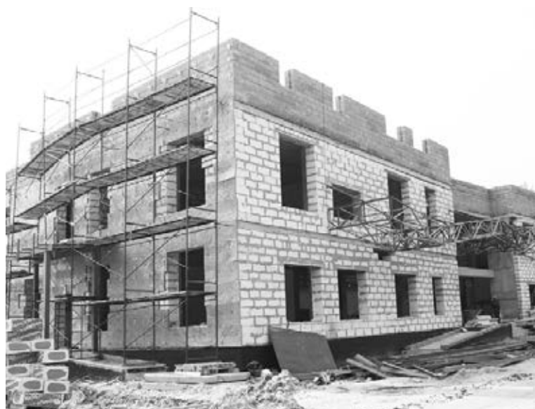
Строительство Центра культурного развития в Дрезне