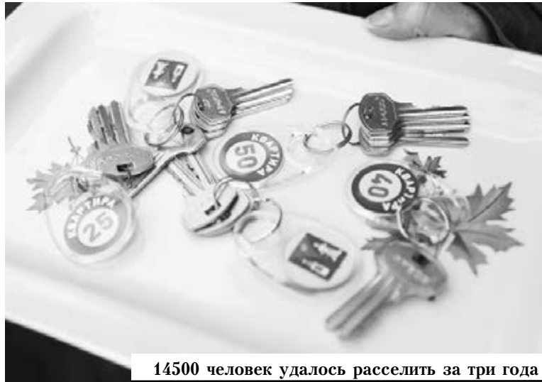
14500 человек удалось расселить за три года

Он также сообщил, что в настоящее время решается вопрос кадрового обеспечения медицинских учреждений. "Поиск врачей, фельдшеров, медсестер — это то, над чем мы работаем, стараемся создавать условия. В частности, каждый фельдшерско-акушерский пункт оснащен жильем. Мы очень надеемся, что наша программа привлечет врачей из разных регионов России, — сказал губернатор. — Мы в этом году планируем привлечь порядка 2 тысяч врачей. Долгое время именно врачи являлись самыми дефицитными ка-