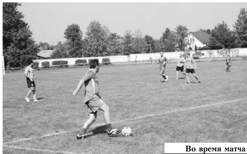
Во время матча