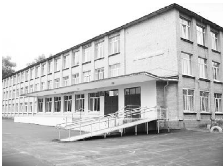
Новая дорога возле Авсюнинской школы