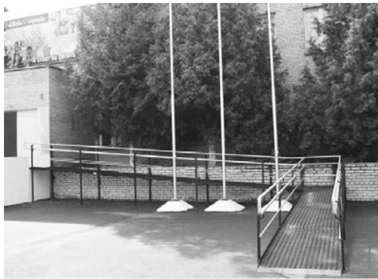
Пандус в Дрезненской гимназии