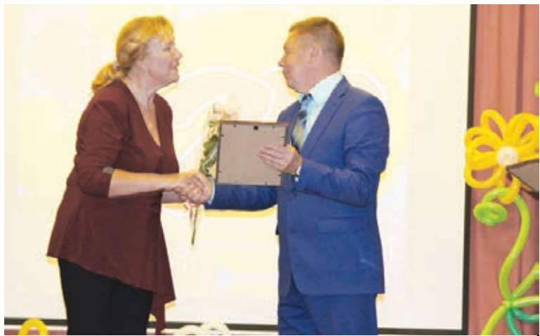
Награждение педагогов школы

Дрезненская школа искусств отметила свой двадцатипятилетний юбилей. В честь знаменательной даты состоялся концерт, на котором воспитанники школы продемонстрировали свои умения.