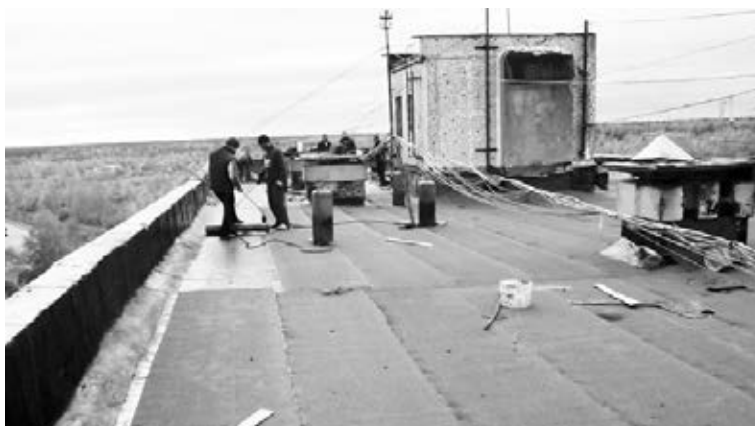
Ремонт кровли дома 38 на ул. Коммунистическая в г. Куровское

Дмитрий ЛЬВОВ По материалам управления ЖКХ администрации Орехово-Зуевского района