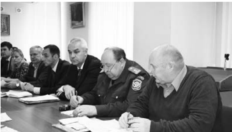
На заседании комиссии

В администрации Орехово-Зуевского района состоялось заседание санитарно-противоэпидемической комиссии под руководством главы района Бориса Егорова.