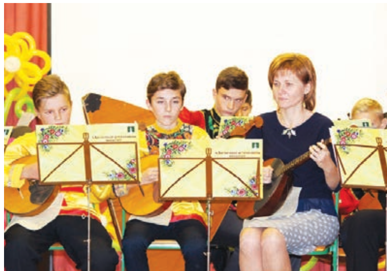
Выступление воспитанников ДШИ