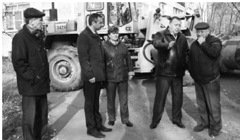
На территории д/с №17