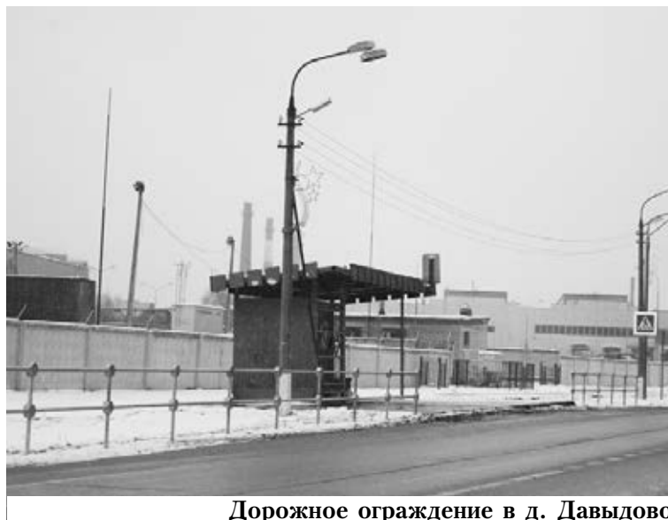
Дорожное ограждение в д. Давыдово