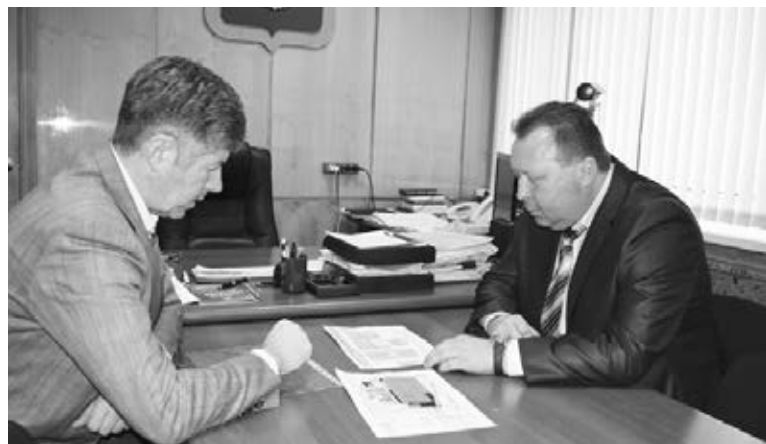
Рабочая встреча с директором компании "Акватон"