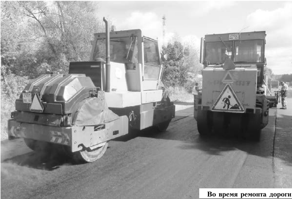
Во время ремонта дороги

Беседовал Дмитрий ТРАВКИН