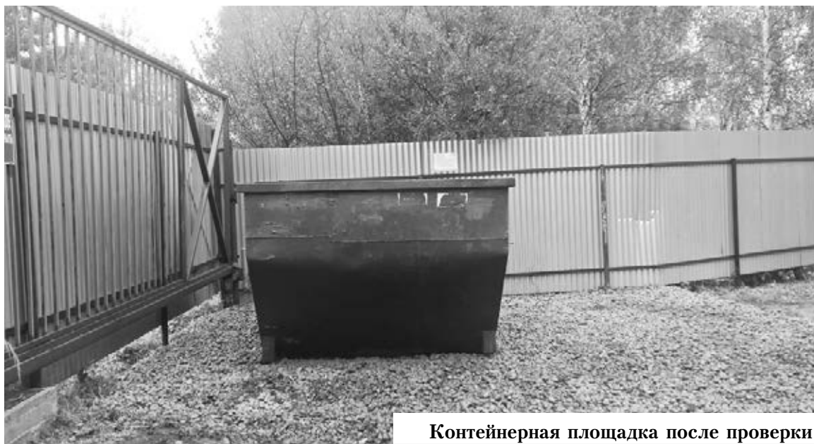
Контейнерная площадка после проверки