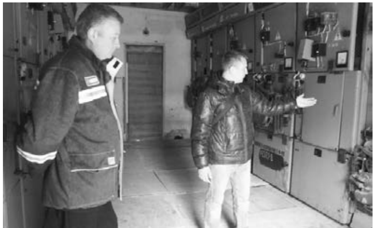
Место, где случилась трагедия