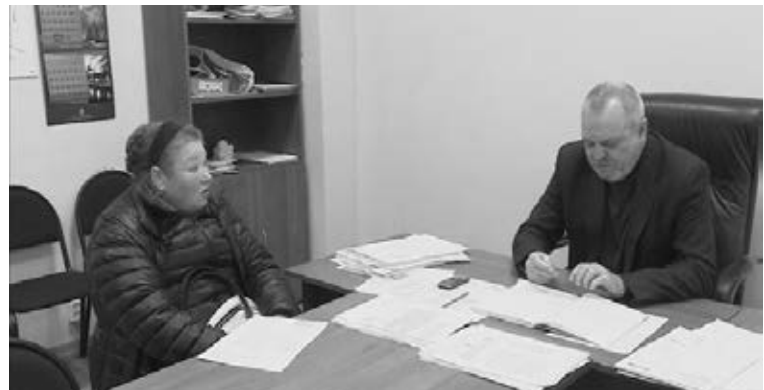
На встрече с директором ООО "Партнер"