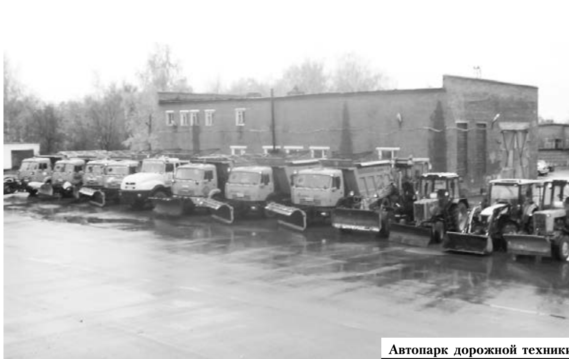
Автопарк дорожной техники

— Сегодня в Московской области много внимания уделяется вопросам безопасности дорог: ремонтируются автобусные павильоны, строят-