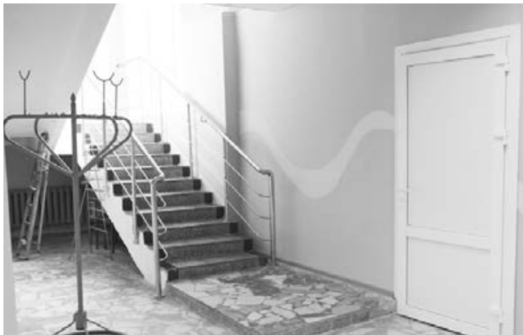
Фойе РДК "Озерецкий"

В ходе рабочего визита Борис Егоров также посетил ремонтируемые клубы района. В частности, он проверил, как идет капитальный ремонт районного Дома культуры в поселке Озерецкий. По словам